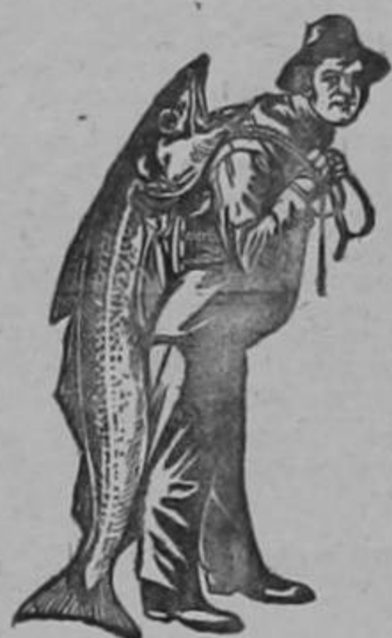
Marca de la Emulsión legítima.

necesitan la Emulsión de Scott , que más que un medicamento es un poderoso alimento